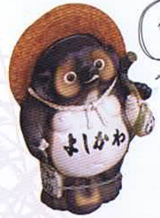
二人とも 僕のようなお腹に ならないでね〜