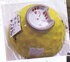
かわい にゃんこのお茶碗