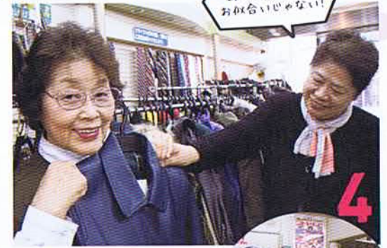
あら! ひでちゃん お似合いじゃない!

「私、ちょっとコート見たいの」と「ジュエリー&リサイクルブティック スエナガ」へ。スエナガさんと、宝石ってイメージあったけど、洋服類もこんなにたくさん売ってるの!? 鎌ちゃんはびっくりしています。 「うちでは、お客様から委託商品を預かってまして、靴やバックなど、女性の身の回りのものはいろいろ扱っているんですよ」とご主人。「そういえば、うちにもうサイズが合わない18金の指輪あるんだけど、買い取ってもらおうかしら」 「そういってお客さんでも、まずはサイズを直したり、デザインをリフォームしたり、いろいろなお提案ができるのも、専門店だからこそ。『ご相談にのった上で、それでも、やっぱり売りたいとなれば買取します』」