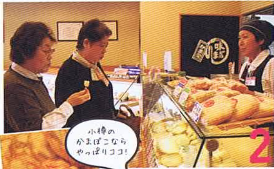
小樽の かまぼこなら やっぱりココ!

「ここの花園本店は、揚げ物や真空パックの商品が一番種類が多いって知ってた?」とひでちゃん。 「でも、堺町のお店のほうが大きいでしょ!」と鎌ちゃん。 「ちがうの、あちは1つの商品が大量に置かれているから多く見えるだけで、種類はこの本店が一番なのよ」 「ありがとうございます。『ひら天』はやっぱり季節問わずの人気ですし、いかボールはこれからの季節、おでんなんかに入ると出汁が出ますよ」とお店の方。 「私は、『ちぎり揚』いただきます」 「そちらは、この店の限定商品で、玉ネギの甘さが美味しいですよ」 創業108年のかま栄さんだけど、すり身を混ぜたりする以外のほとんどは、今も手作業で作ってるんだって。