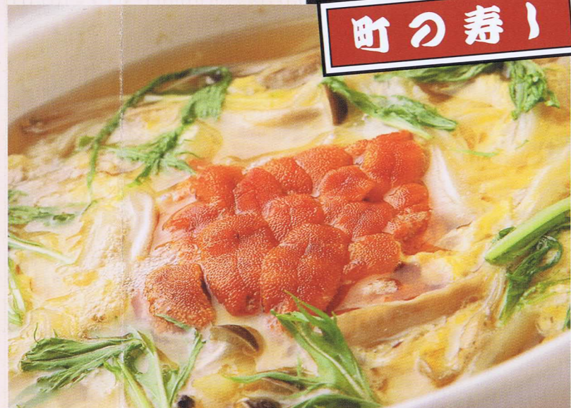
濃厚なうにの味わいが効いた「うに鍋」。身体の芯から暖まる。