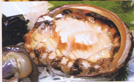
▲ コリコリの歯触りがたまらない「活あわび刺身」