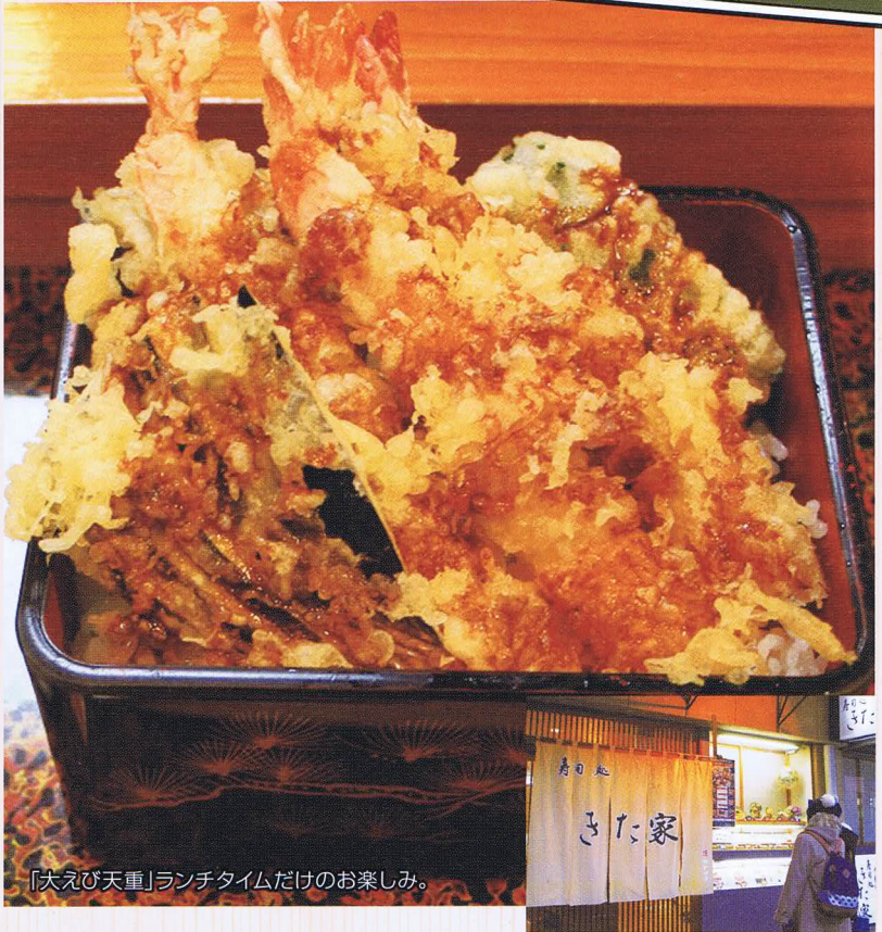
「大えび天重」ランチタイムだけのお楽しみ。