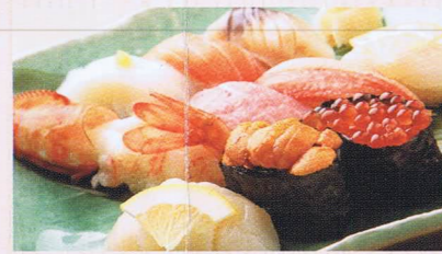
▲もちろんお寿司は鮮度バツグン

【町の寿司】 稲穂1丁目1-1 営業時間/11:00~21:00 定休日/元旦 ☎0134-25-3430