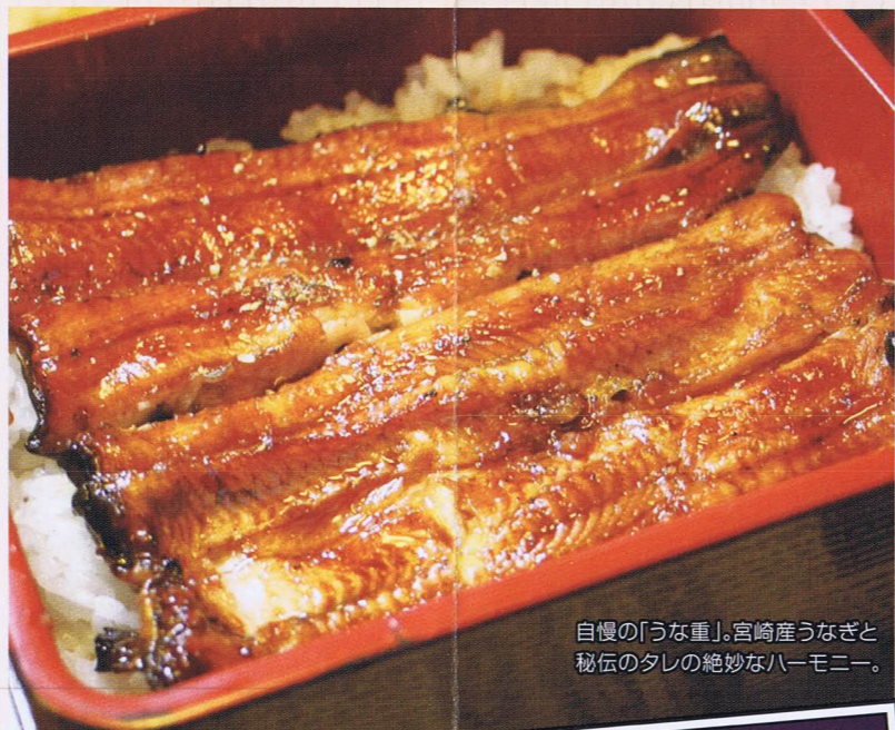
自慢の「うな重」。宮崎産うなぎと秘伝のタレの絶妙なハーモニー。