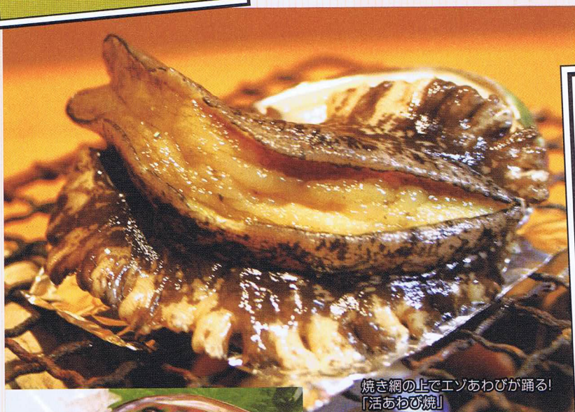
焼き網の上でエゾあわびが踊る！ 「活あわび焼」