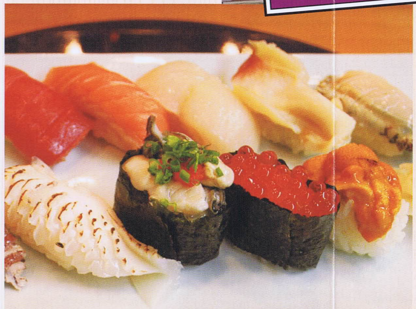
すし勘の技が光る「旬の握り」